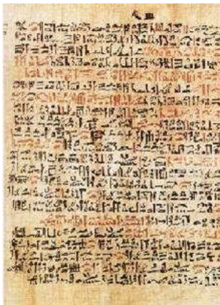
Figura 6: O Papiro de Ebers ( http://www.ugr.es/~ajerez/proyecto/imagenes/historia5.jpg , 2008)

como ingrediente principal nos chamados unguentos de vôo preparados por bruxas.