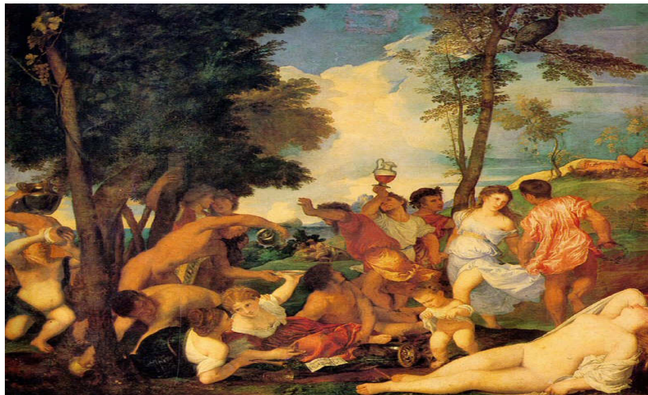
Figura 3: “ O Bacanal” - Obra de Tiziano Vecelli ( http://www.uco.es/.../Galerias/12Bacanal-Tiziano.JPG , 2008)

los e comê-los. É provável que ao vinho dos bacanais fosse adicionado sumo de beladona.