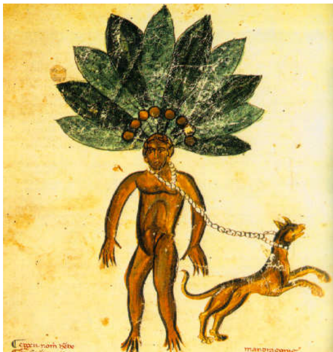
Figura 7: Representação da raiz ( http://beckerexhibits.wustl.edu/Herbal/1/codex1.jpg , 2008).

obtê-la era prender a raiz na coleira de um cão faminto, e açoitar o animal. Este ao tentar a fuga arrancava a raiz e caía morto.