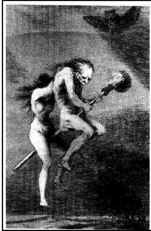
Figura 2: Representação das bruxas na Idade Média ( http://www.geocities.com/alkimist_2000/BRUXAS.jpg , 2008).

Os efeitos alucinantes e a sensação de voar causado por estas ervas podem ser explicados pela presença dos alcalóides tropânicos escopolamina, atropina e hiosciamina, no unguento. O nome dado ao gênero Atropa vem de Átropos, uma das 3 parcas da mitologia grega, a inflexível, aquela a quem cabia cortar a corda ou o fio da vida. As outras duas eram Cloto, a fiandeira e Laquésis. Estas 3 divindades eram responsáveis pelo destino das pessoas. O nome Atropa faz jus aos usos letais causados pela ingestão de quantidades moderadas desta planta.