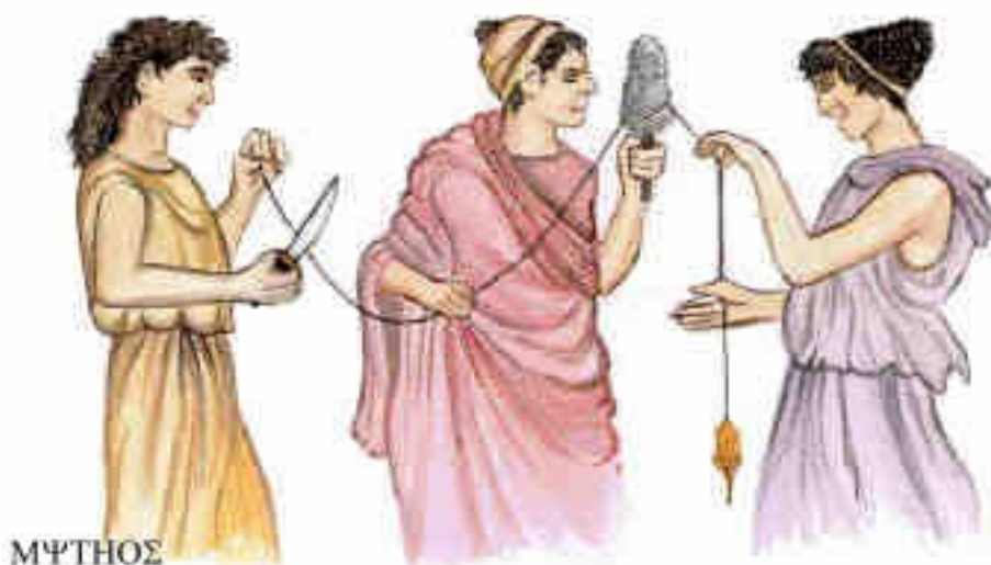
Figura 5: Representação das Parcas.

A atropina foi isolada pela primeira vez em 1831 da espécie Atropa belladonna por um químico alemão chamado Mein, entretanto a espécie já era conhecida por suas propriedades terapêuticas entre os romanos, egípcios e gregos.